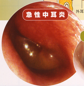
急性中耳炎を起こした耳。鼓膜が赤くはれています。